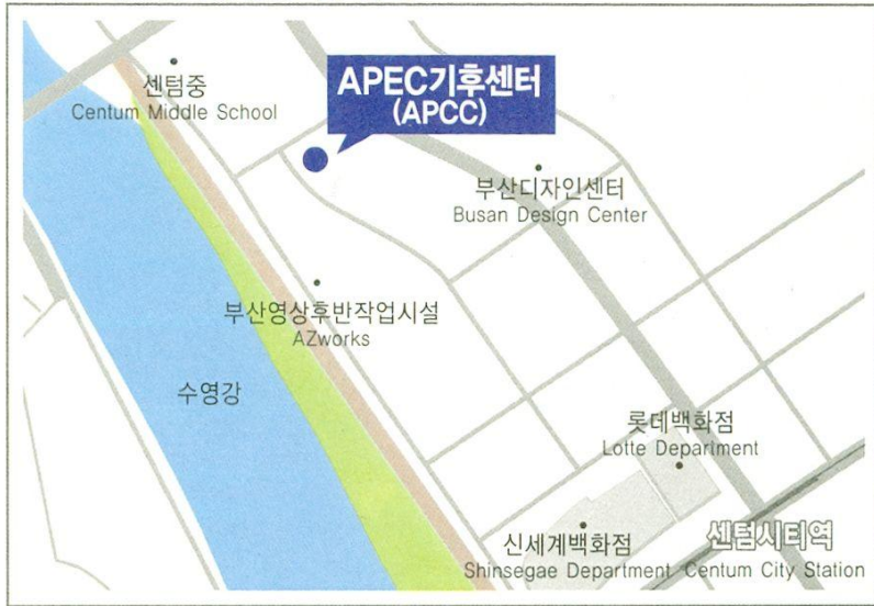
부산지하철 센텀시티역 하차(도보로 15분 거리)